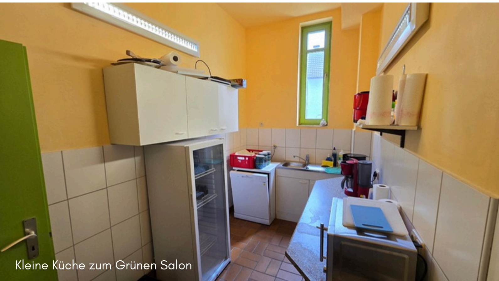
Kleine Küche zum Grünen Salon