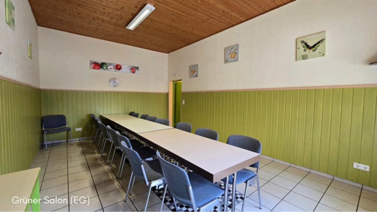
Grüner Salon (EG)