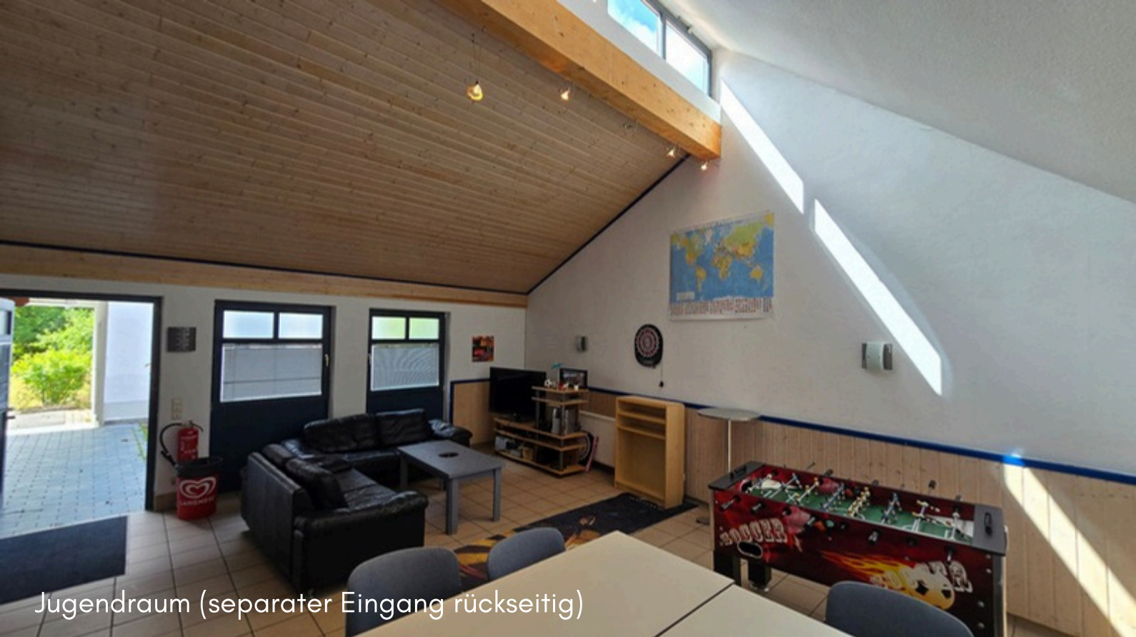
Jugendraum (separater Eingang rückseitig)