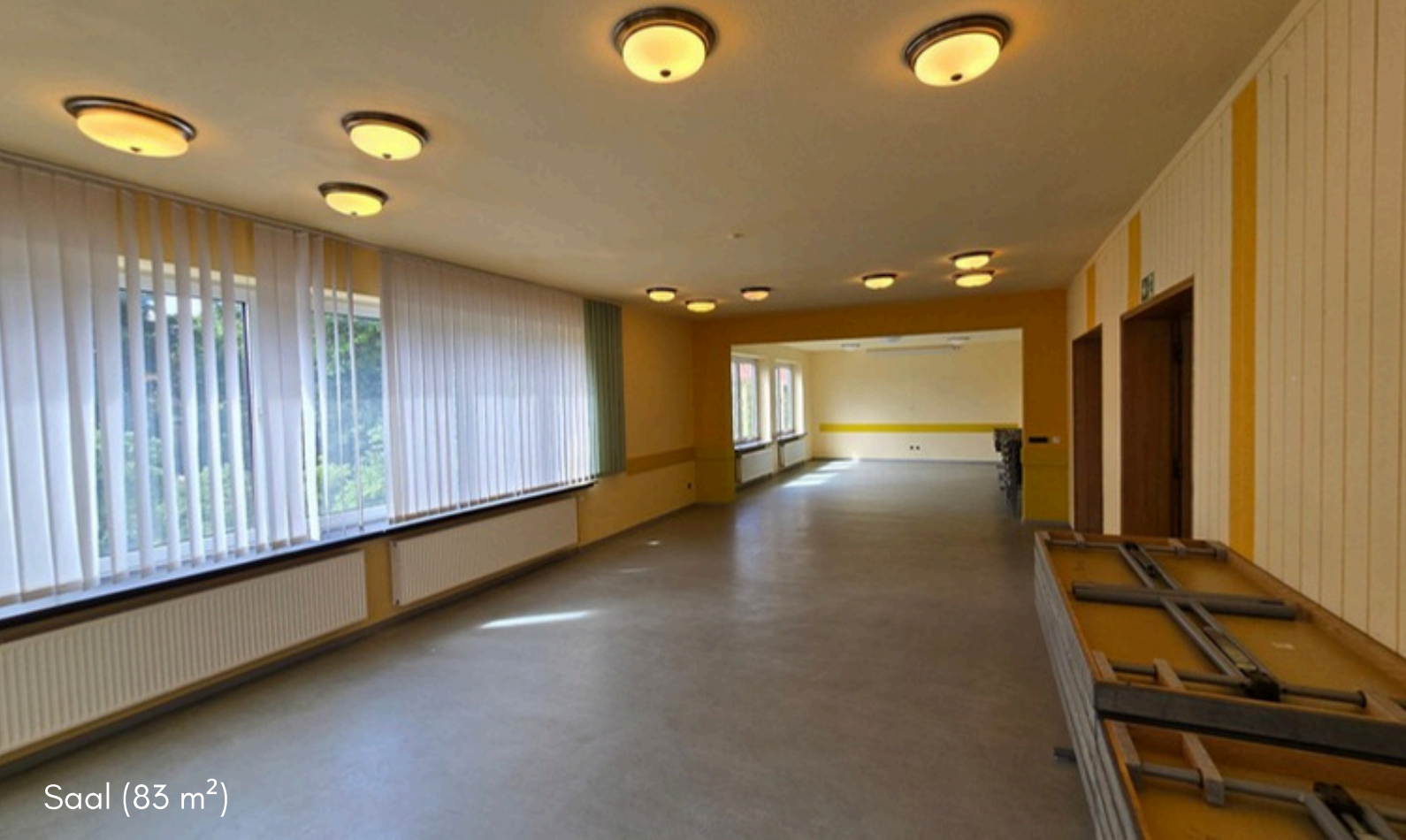
Saal (83 m 2 )