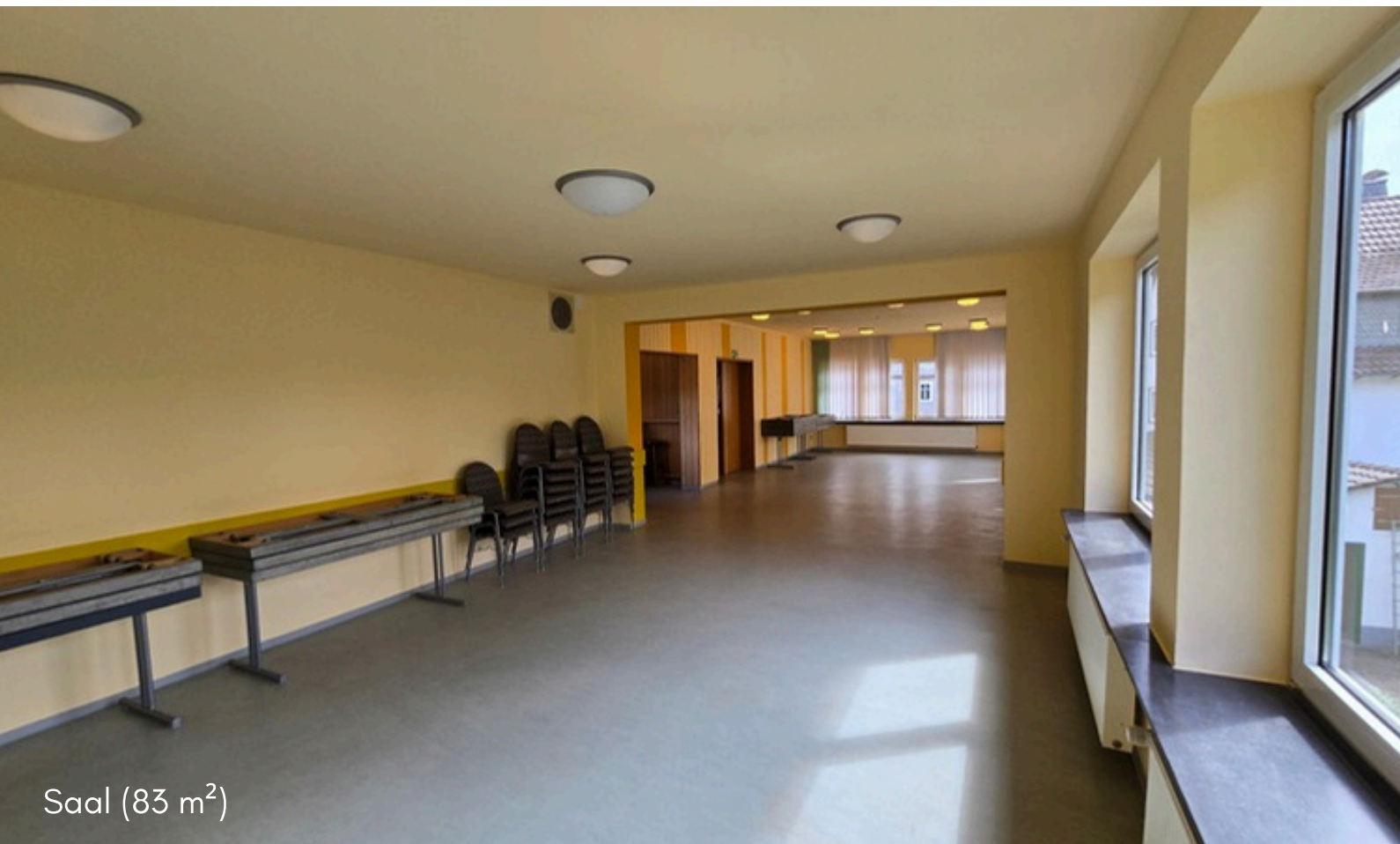
Saal (83 m 2 )